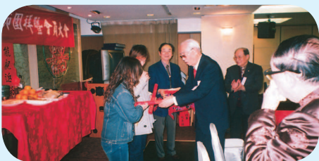
◆ 彭理事長登壇頒贈獎助學金。