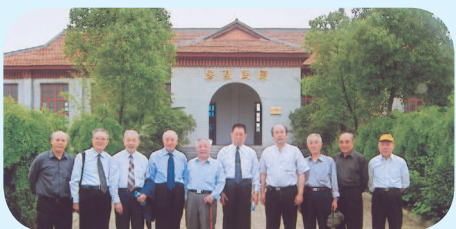
◆ 旅台返棗鄉親與出席雕龍碑文化研討會各位專家合影。