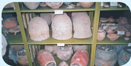
◆ 雕龍碑遺址出土的發掘物品。