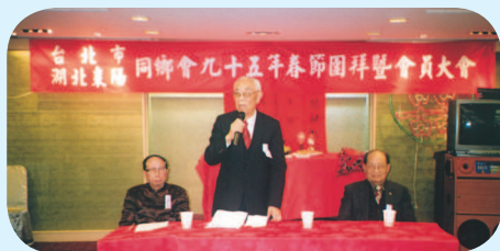
◆ 彭理事長登壇講話。