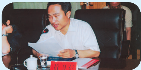
◆ 中國社科院考古研究員黃衛東代表在研討會上，作主題報告。