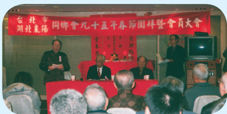
◆ 曹總幹事明傑工作報告。