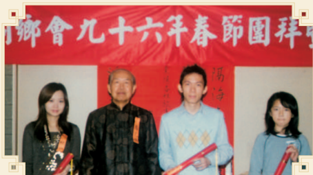
● 羅理事長（左二）與領取獎助學金鄉親合影。