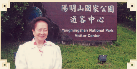
● 謝鄉親暢遊陽明公園。