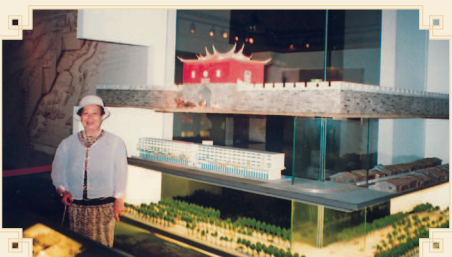
● 謝鄉親參觀台北市府“探索館”於台北古城模型前留影。