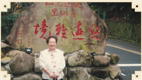
● 謝鄉親在陽明公園「悠遊雅境」。