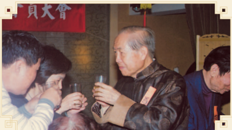
● 羅理事長（中）向鄉親敬酒。