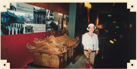
● 謝鄉親參觀台北市府“探索館”瞭解古台北。