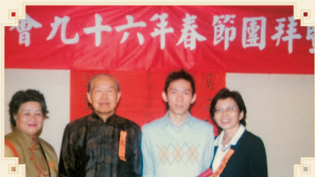
● 羅理事長與領獎鄉親家長等合影。