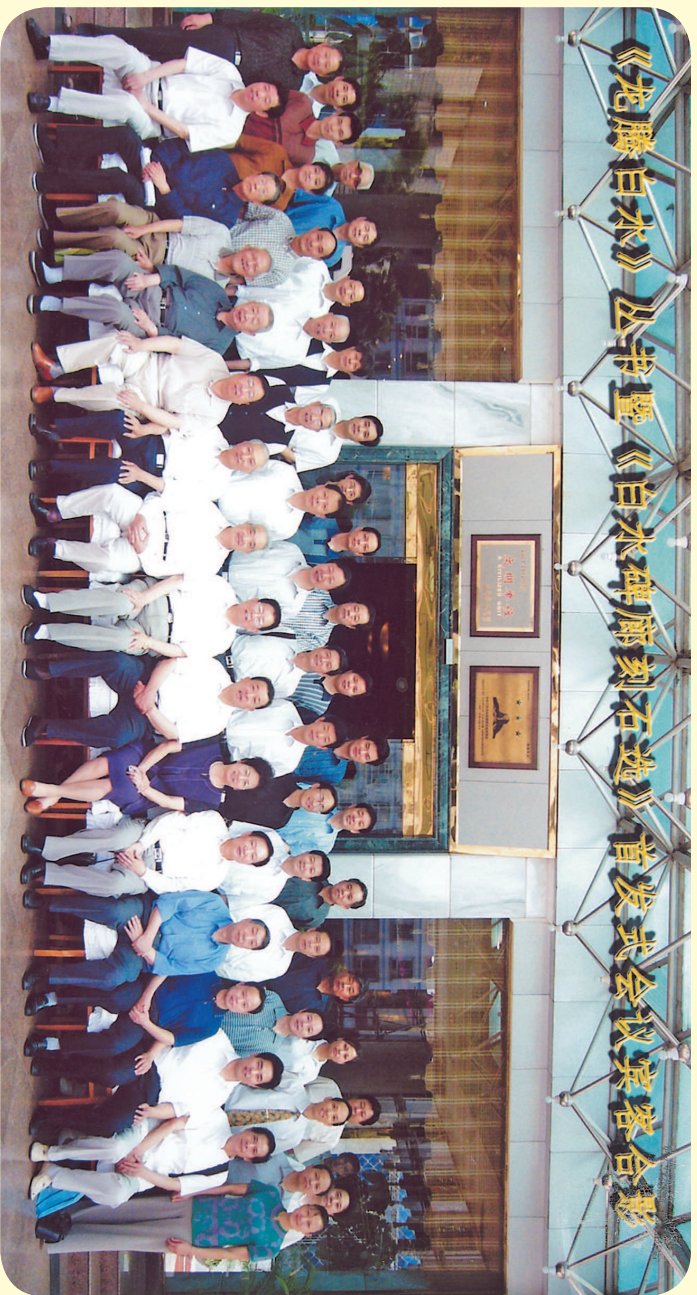
● 棗陽「龍騰白水」叢書暨「白水碑廊刻石選」首發式會議。賓客合影