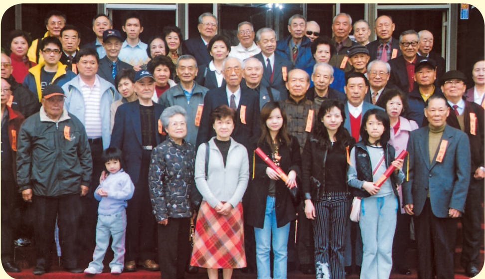
● 出席96年春節祭祖、團拜，餐敘的棗陽旅台鄉親合影。