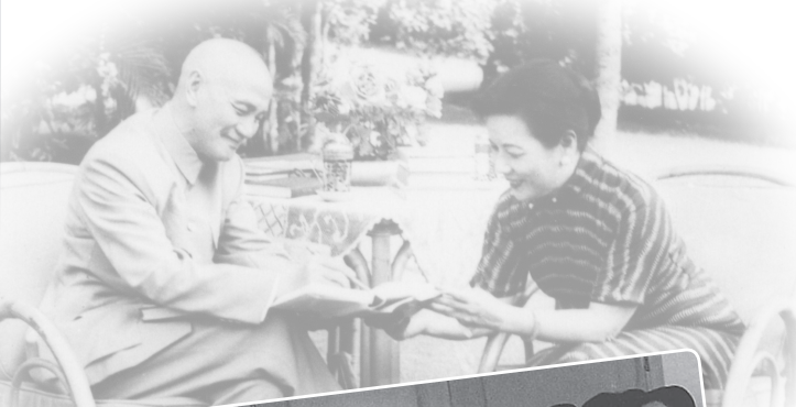
故總統蔣公伉儷情深。