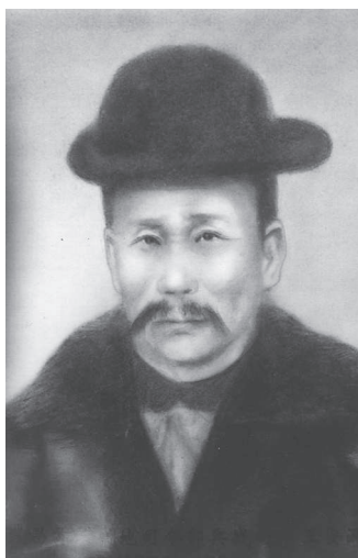
武昌起義，戰地司令部兵戰司令王安瀾將軍畫像。

如欲更进一步瞭解，王安瀾將軍事功。請參閱民國九十年，棗陽文獻第十九期，其外孫蕭平先生所撰將軍之路。——記外祖父王安瀾將軍戰鬥的一生。