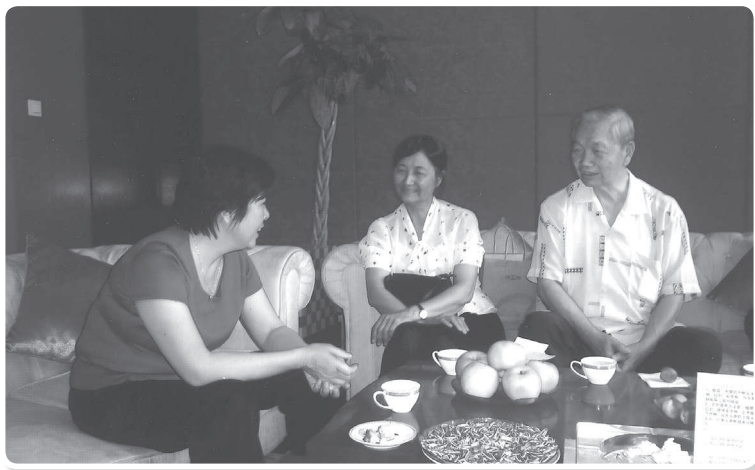
返鄉探親，承邱副市長光秀（左一）全程陪同至為感謝。

使體重增加。在兩次酒宴間，讓我情不自禁的說了幾句話，我說我很感激各位領導和親友的感情招待，我像蝗蟲一樣，吃了四方，盛情難忘。同時我也情不自禁的引用孟子「以力假仁者霸，以德行仁者王」銘言，希望兩岸在「和平發展」理念下，能以