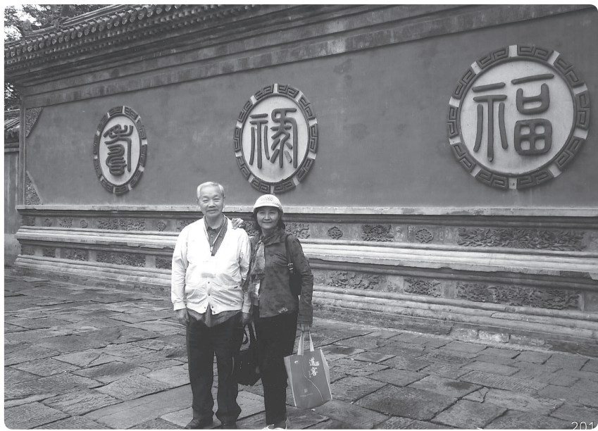
參觀武當山太子坡在福祿壽照壁前合影。