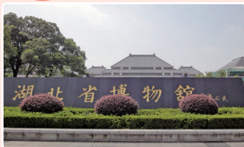
●湖北省博物館 (位於武漢)。