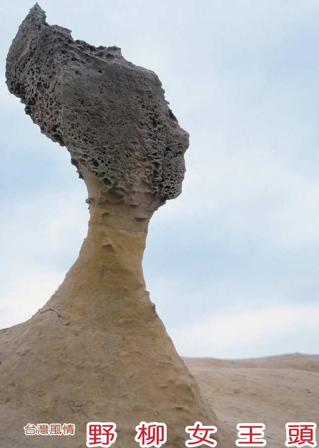
台灣風情 野柳女王頭