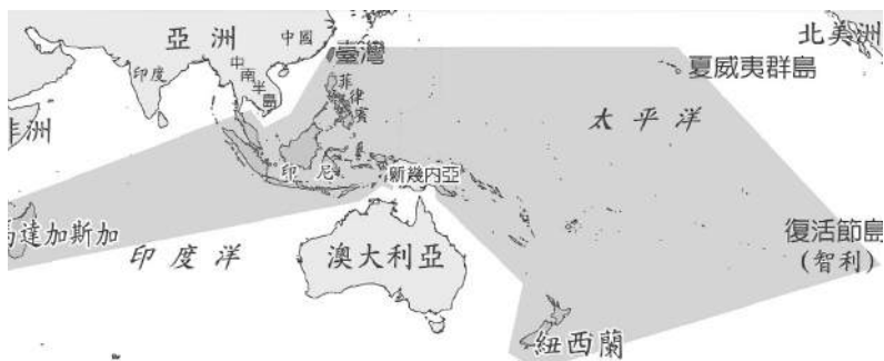
南島語分布圖（圖十）

六千年前有南島人移入（如圖十）。之後，有文字記載臺灣，始自隋朝，之後至南宋，才又出現臺灣與澎湖的記載。南宋時澎湖已成為閩南人捕魚時的聚散地。在史書文忠集汪大猷著神道碑，就有海中大洲號澎湖，邦人就置粟，麻的記載。又於一一七一年南宋乾道七年，泉州知縣汪大猷，曾遣軍民屯居澎湖戍守，澎湖時稱平澎，自此算是中國官方首次在澎湖住兵，然其只是臨時性，不久即廢置。