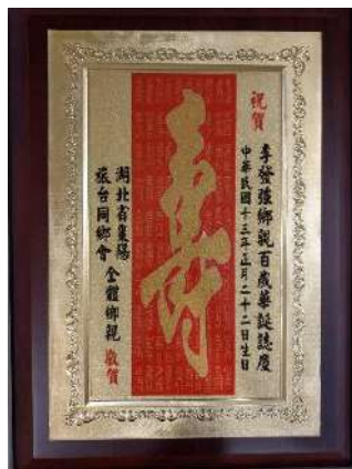
癡年百歲，湖北棗陽同鄉會全體鄉親鑄『壽』字一座，向作者頌祝百歲壽

對於八字命理，陸致極博士曾介紹八字命理學，就是陰陽五行之學，因東漢思想家王充之提倡，歷經東漢到唐代李虛中的推演，再至五代宋初的徐子平，傳到明代中葉共三個階段，再從明清到現代，經過徐樂吾、袁樹珊、韋千里等人的整理，評注和出版，並累積了歷代名人如清代康熙皇帝、慈禧太后、近代杜月笙、胡適、袁世凱、孫中山近百人之命造，受到重視與發展，使八字命理學漸成顯學。而我個人一生至今，尚未看過相、算過命，但對此中國人之傳統智慧，卻漸感興趣，對於人生之富貴貧賤，對於人生不易，頗多感想，例如有資料說宇宙形成已有 800 至 1200 億年，地球形成約有 45 億年，生命起源於 5 億年時，人類出現只有 250 萬年，由於人心有善有惡，使民主變成對抗，科學的忽視，形成農業、工業、資訊、數位、意識能，一波又一波的革命，使人性變質，癡狂痴亂，科學發展，破壞生態，人類思想可以毀滅地球。地球生物經 4 億 4 千萬年前的奧陶紀時代到距今 6 千 5 百萬年前的白堊紀時代，曾經發生過 5 次的「生物大滅絕」，每次生物大滅絕都在 80%，現在又有第 6 次的「生物大滅絕」，其對像是脊椎動物，包括人類在內。這次的新冠病毒