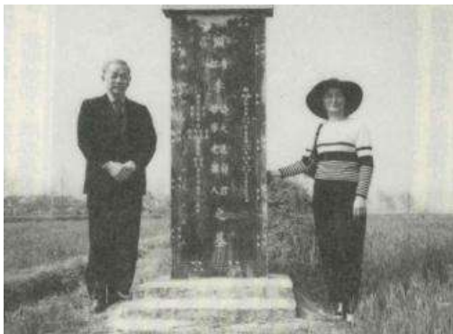
雙親墳墓被剷平後，再於 墓旁田角豎石碑致念

至於陳水扁夫婦以三級貧戶仍能出任總統，是民主之賜，後竟空前貪污而不認罪，被臺北地方法院蔡守訓法官判決陳水扁總統濫權，在判決文中說：『身為國家元首，當知「一家仁、一國興仁；一家讓、一國興讓；一人貪戾、一國作亂」(大學傳文之九章，釋齊家治國)，又云「作之君，作之師」(尚書)，後有暗示扁以兩顆子彈意圖連任兩任總統，本應為民表率福國淑世，却為一己之私，縱容家人和親信以權生錢，還詐領國務機要費』。我們應為蔡法官正義之聲喝采，而陳水扁不僅不認罪，且以小丑之姿，要求假釋。民進黨在立法院又以多數黨席次竟強勢通過貪污機要費無罪，是乃「士大夫無耻，是為國恥」，何其可悲也。