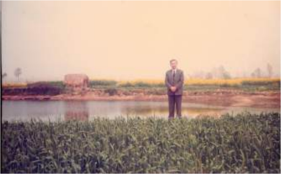
圖 2-4 世事多變，昔日家園—竹園，今成草寮

在「皇村」村前有一條小河，名叫「滾河」，也叫「白水」，此水流向異於一般流向。中國一般河流都是由西向東，惟此水是由東向西流，中經漢水流入長江，再匯入東海。所以有人說襄陽人有異於一般人，喜稱「白水人」，充滿「有所為亦有所不為」的性格。劉秀能做皇帝，大概就是有此性格才有皇帝命。