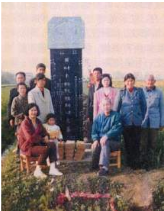
圖 2-3 作者雙親墳墓被剷平後，再於墓旁田角豎石碑致念

我們住在「竹園」環境很好，竹園建村總在百年以上，因為經不起風吹雨打，在國共內戰停止，雙方開放探親後，我所見到的家園，已經變成一堆廢墟，但是我仍愛它，因為它曾經是我們李家的根。我的雙親墓地就在「根」的附近，但已被剷平，感謝族侄萬霞、萬葛捐贈石碑一座，以致永念。