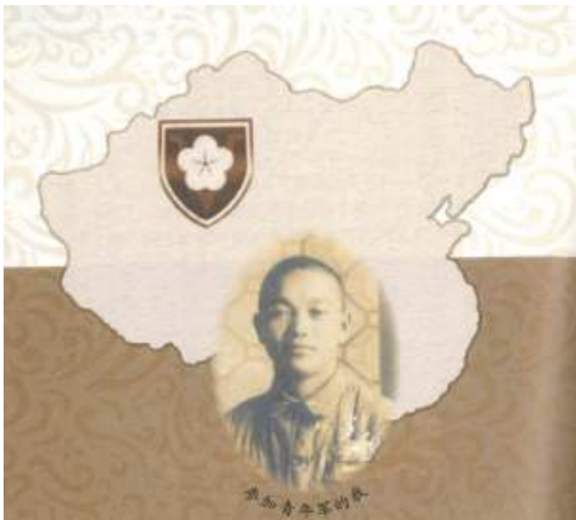
圖 2-5 作者參加抗日志願從軍之留影

校友研商決定要轉學台灣，已如前述。但經千辛萬苦抵達台灣後，因教育部尚無轉學法規，只好重披戰袍投入抗日英雄孫立人將軍屬下。