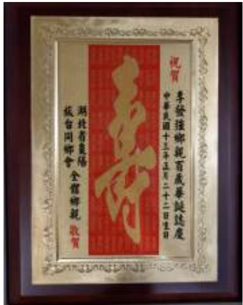
圖 2-11 作者癡年百歲，湖北襄陽同鄉會全體鄉親鑄『壽』字一座，向作者頌祝百歲壽慶