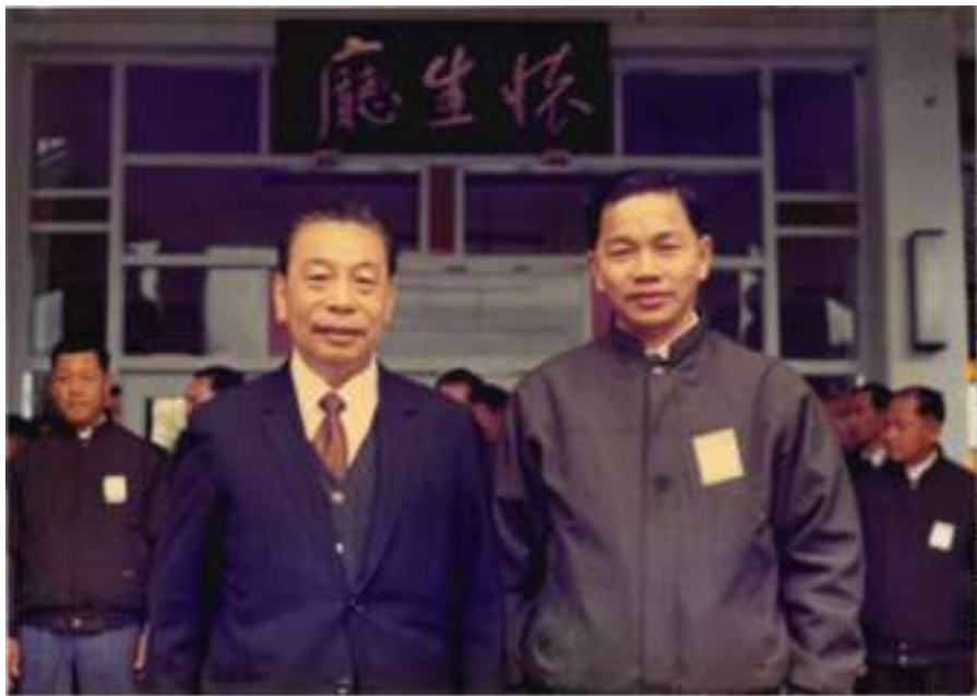
圖 2-6 蔣主任經國先生與作者合影

後來有幾位校友考入政工幹校，受到器重，被授予法庭庭長、財務副署長、省立高中校長、大學系主任、大學副校長等，還蒙經國先生個別召見，徵我到救國團負責青年愛國教育之策畫及執行工作。當大陸文革時，政府成立「中華文化復興文化委員會」，蔣公為主任委員，陳公立夫為副主任委員，我亦得幸時有接觸，因此承蒙陳公簽名題贈「四書道貫」、「肖像」、「法書」，文曰：「律己以誠、待人以仁、處事以中、成物以行、知斯四者而篤行之，則身修而家亦齊矣」。後來我以「誠、仁、中、行」為我座右銘，受益良多。