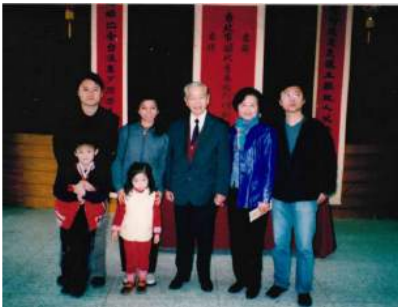
圖 2-2 作者之全家福

我說「我是襄陽人，因為我的祖先都在襄陽，襄陽是我的老家」，由於家為國本，人為家本，家是我們的根，我們本來就愛我們的根。有了「襄陽人」，介紹古今襄陽之歷史文化等，更是使我愛襄陽，謹在此向「襄陽人」敬謝，並向全體為襄陽人服務，辛苦貢獻的工作同仁，表示最大的感謝和敬意，所以我每期都愛閱讀「襄陽人」，容我再說聲謝謝!謝謝!