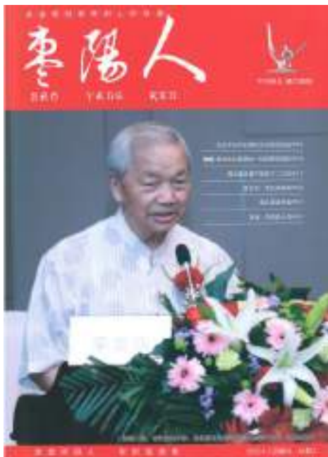
圖 2-12 家鄉「棗陽人」名刊將作者列為封面人物之玉照， 也是對旅台鄉親之首例刊載，僅謝！

近讀台灣已故佛教領袖淨空法師精選「諸子治要」及「群書治要」，兩書名言倡導道德教育及兩岸和平，又出版「老人言」一書，印贈各界，並由北京中共中央黨校任登第教授親撰「老人言、聖人訓」，劉余莉教授撰「中華傳統倫理與當代道德建設」，北京師大郭齊家教授撰「拜讀『老人言』」，頗值關心國事 及人類前途之各界人士閱讀，對弘揚中華文化與復興中華民族，促進人類生存，頗有貢獻，值得一讀。