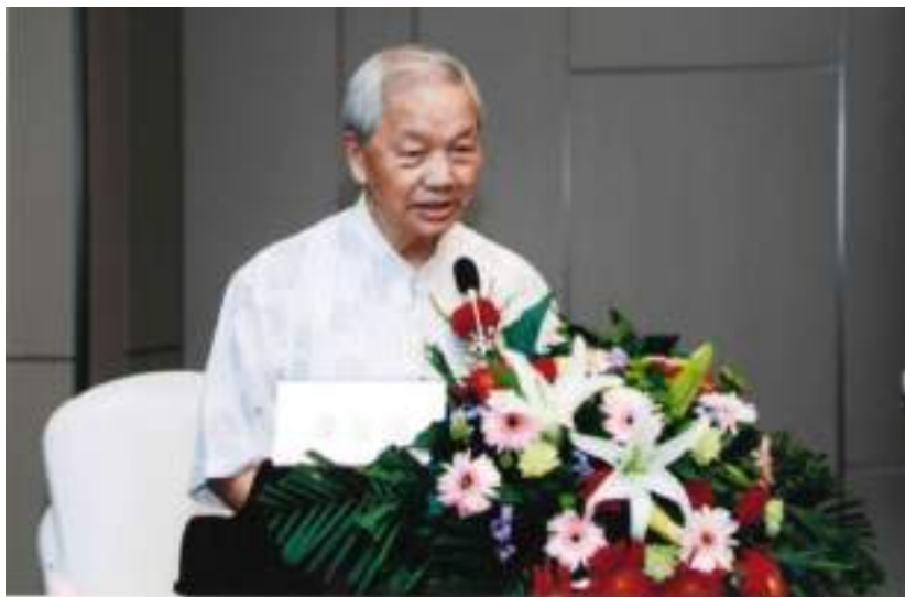
圖 2-1 作者近照

今年欣逢「棗陽人」創刊十周年，十年以來，「棗陽人」在創刊人劉正文先生為弘揚棗陽文化，邀請了棗陽各界名人、才士，服務天下棗陽人，成就卓越，每期都蒙免費贈閱，擴大了我對棗陽古今歷史文化的認識。