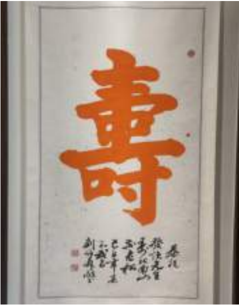
圖 2-10 湖北名書法家劉公恆森(湖北省台辦前副主任)向作者致贈『壽』字祝壽